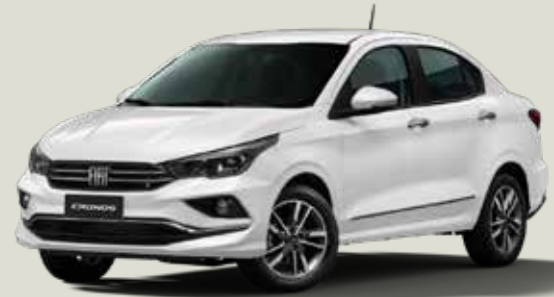
249 - Blanco Banchisa