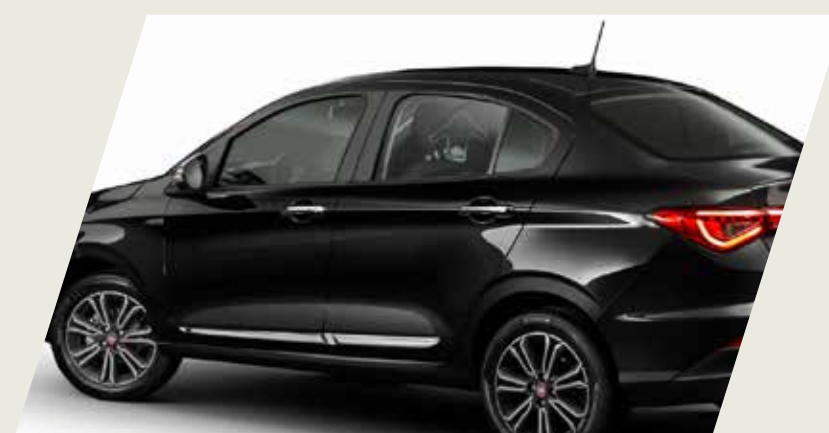
MOLDURA DE PUERTA CROMADA