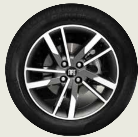
Llantas de aleación 16" SERIE