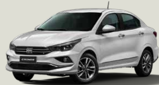
534 - Blanco Alaska