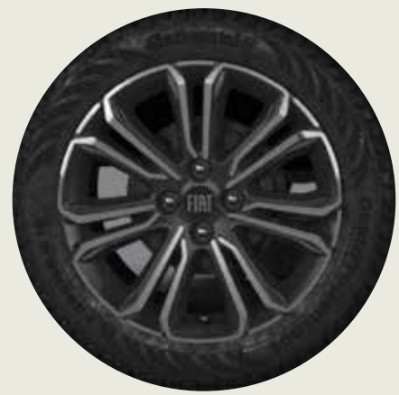
Llanta de aleación 16" OPC