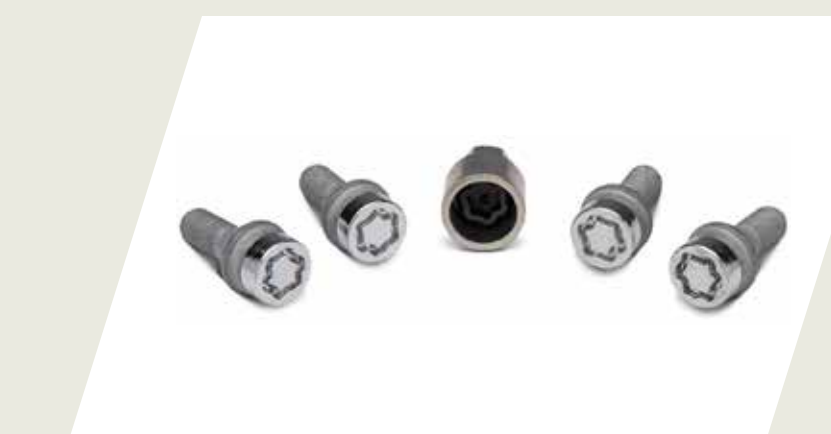
JUEGO DE TORNILLOS ANTIROBOS PARA RUEDA