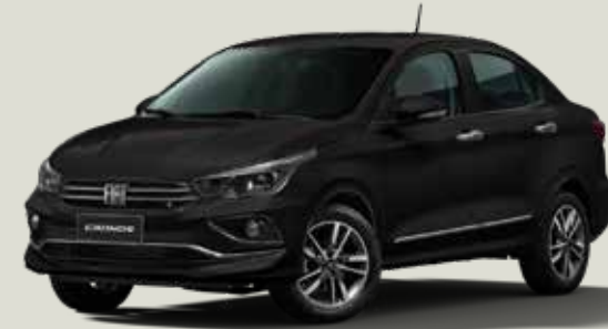
806 - Negro Vulcano