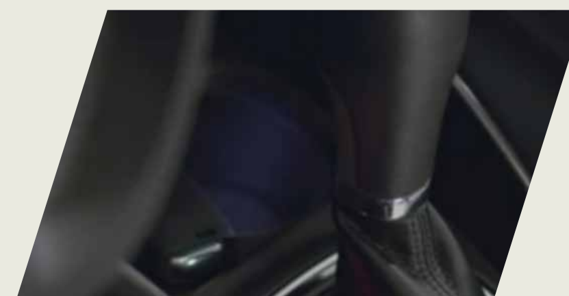
KIT ILUMINACION INTERIOR