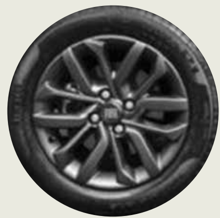
Llantas de aleación negra 15" OPC