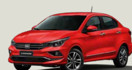
978 - Rojo Montecarlo