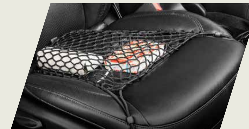
RED ELÁSTICA DE ASIENTO DELANTERO