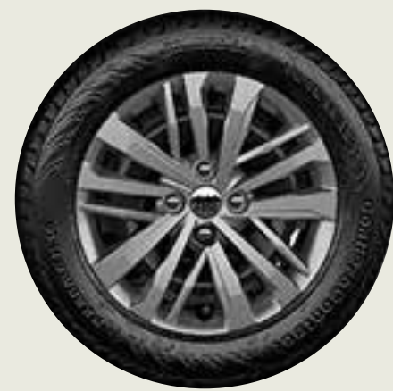
Llantas de acero 15" OPC