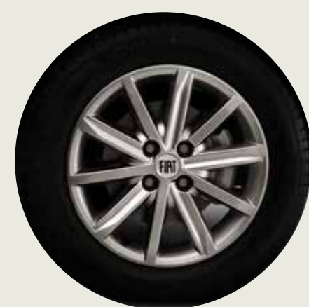
Llantas de aleación 15" SERIE