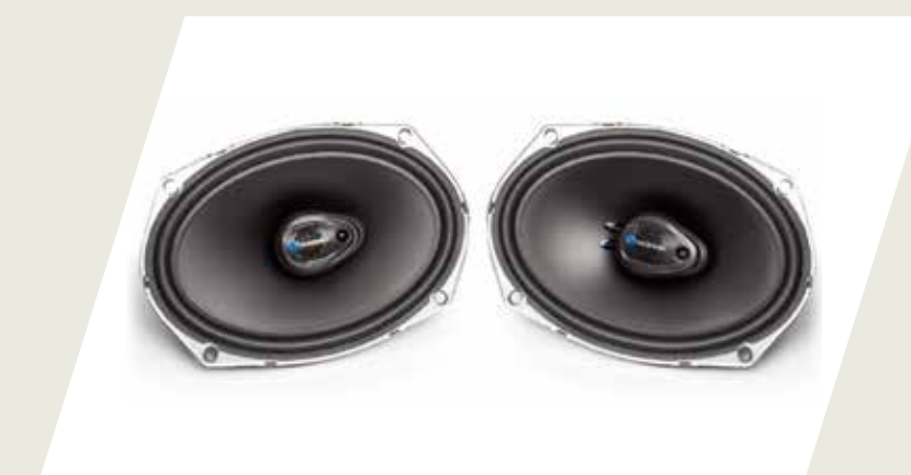
KIT PARLANTES DELANTEROS