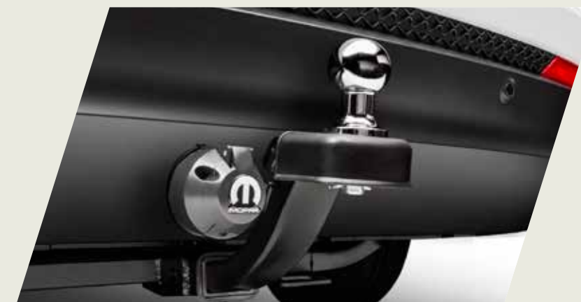
GANCHO DE REMOLQUE