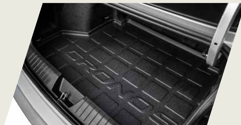
ALFOMBRA BAUL ANTIDERRAME