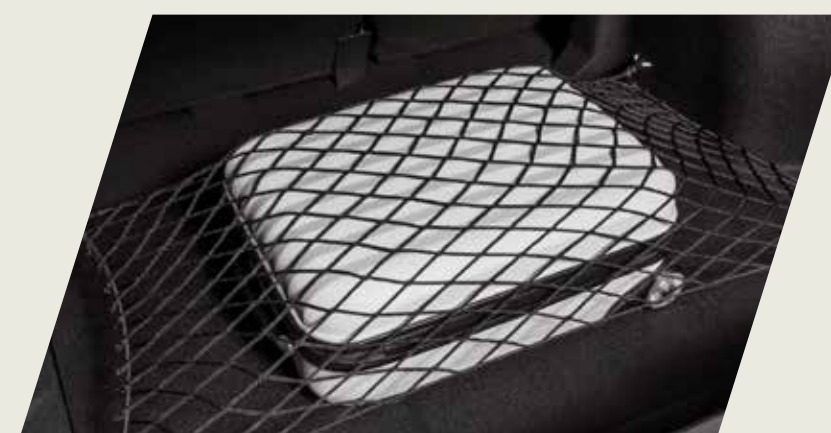
RED ELÁSTICA PARA BAUL