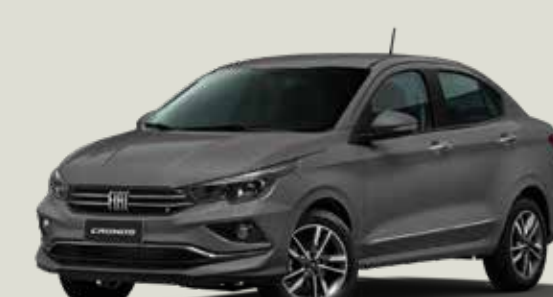
979 - Gris Silverstone