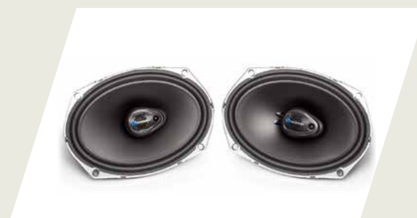
KIT PARLANTES TRASEROS