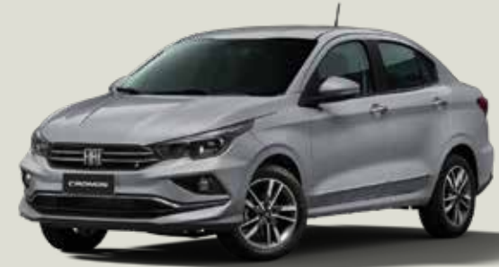
619 - Plata Bari