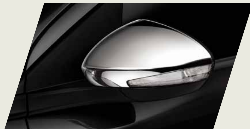
TAPA ESPEJO RETROVISOR EXTERNO CROMADO

Acercate a un concesionario y conocé la gama de accesorios originales que mopar te ofrece para equipar tu fiat Cronos, seguido de las imágenes de cada accesorio.