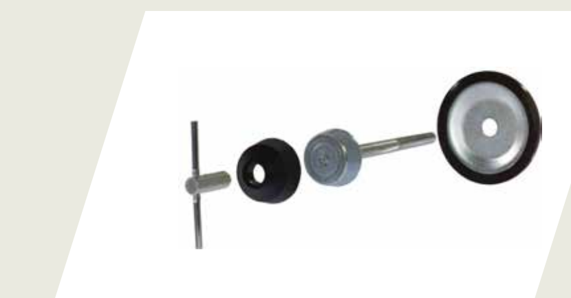
BULÓN DE SEGURIDAD PARA RUEDA DE AUXILIO